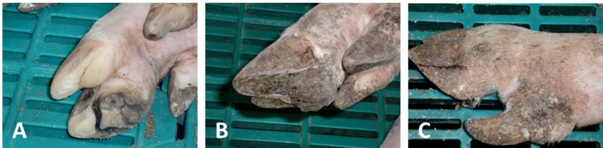
Фигура 1: Често срещани увреждания на копитата на разплодни свине; Пукнатини по стъпалото (А), Пролиферация на стъпалото (В), Пукнатини по стенния рог (С)

Един от критичните фактори, определящи продължителността на използване на свинете майки е здравния статус на копитата. Около 10 - 20% от всички бракувани свине напускат стадото заради проблеми с крайниците. Но това е само върхът на айсберга. Освен високата цена за подмяна на бракуваните свине, увредените копита (Фигура 1) намалят цялостната продуктивност на стадото. Например, чести последици от влошеното копитно здраве са по-високия брой на смачкани прасенца, повече повторни осеменявания и свързаната с това ниска заплодяемост, повишени разходи за лечение. Заедно с условията в сградите и генетиката, факторите свързани с храненето са добре познати с положителния си ефект върху копитното здраве. Тези хранителни фактори включват осигуряване на адекватни нива на някои важни микроелементи и по-специално на Цинк, Манган и Мед.