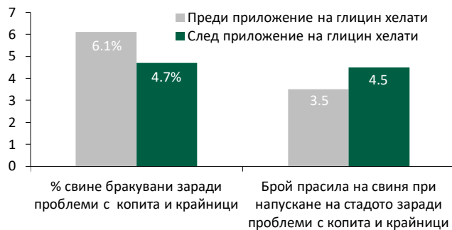
Фигура 4: Ефект на глицин хелати (E.C.O.Trace®) върху брака и продължителността на използване на свинете.